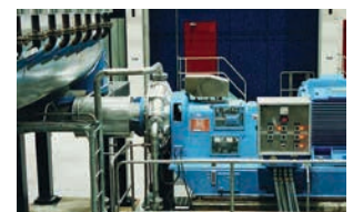
Scheibenrefiner mit Spezialventil SK 700

Disc Gap Control (DGC) Systeme sind weltweit in Zellstoff- und Papierfabriken installiert. Diese Systeme eignen sich für die meisten neuen Refiner, ermöglichen aber auch eine leichte Nachrüstung bestehender Maschinen. Das System besteht aus einem manuell- oder schrittmotorgesteuertem hydraulischen Servoventil mit mechanischer Rückmeldung von der Maschine und einem Positionssensor für die Plattenposition. Der Mahlspace wird von einer elektronischen Einheit geregelt und der Verschleiß angezeigt. Der Mahlspace kann manuell oder mittels Sollwertvorgabe eingestellt werden und wird unabhängig von variierender Last oder Spannungsausfall konstant gehalten.